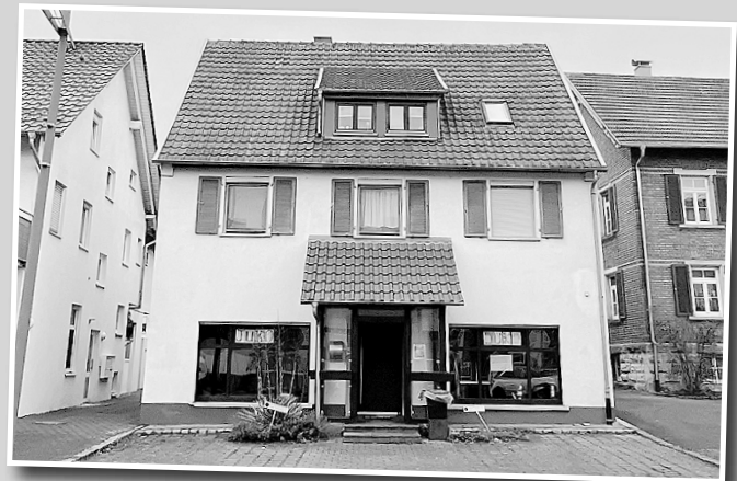
Der Kinder- und Jugendtreff ist im Erdgeschoss in der Abtsgmünder Straße 12.

Siehe auch unter Aktuelle Berichte, Seite 13, in dieser Amtsblattausgabe.