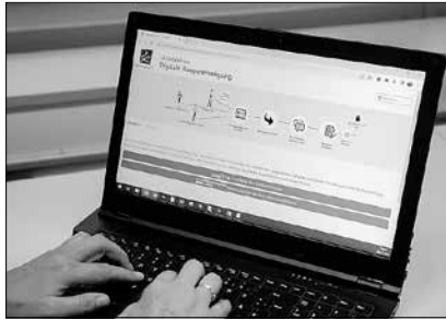
Das Herzstück von „ViBa BW“: der digitale Vorgangsraum

Unternehmen und Architekturbüros künftig ein nutzerfreundliches Online-Bauverfahren zur Verfügung. Bevor das Verfahren für alle potenzielle Antragstellende komplett geöffnet wird, wird das „Virtuelle Bauamt Baden-Württemberg (ViBa BW)“ im Ostalbkreis zunächst vom Landratsamt gemeinsam mit den Gemeinden Essingen, Jagstzell, Kirchheim am Ries, Spraitbach, Stödtlen und Wört getestet. Auch vier Architekturbüros haben sich bereit erklärt, an der Testphase teilzunehmen. Nach erfolgreicher Pilotierung erfolgt dann der Rollout des „ViBa BW“ für alle weiteren Kommunen, für die das Landratsamt als untere Baurechtsbehörde zuständig ist.