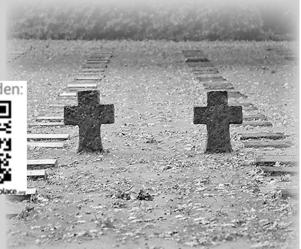
Kriegsgräberstätte in Menen in Belgien. Es liegt ein Gefallener aus Hüttlingen auf dem Friedhof.