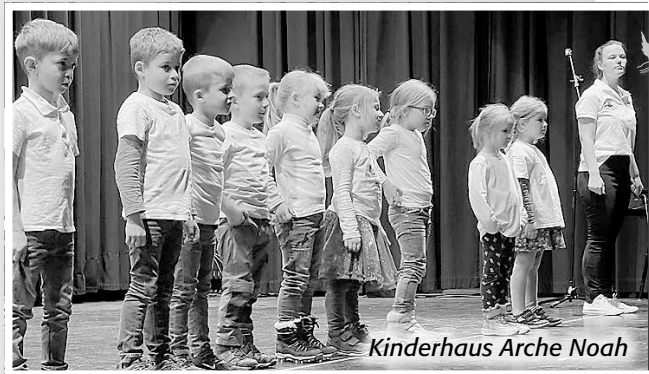
Kinderhaus Arche Noah