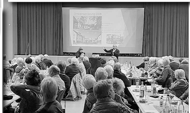
Präsentation der letzten 22 Jahre