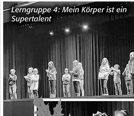
Lerngruppe 4: Mein Körper ist ein Supertalent