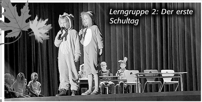
Lerngruppe 2: Der erste Schultag