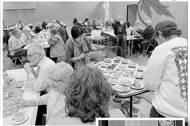
Gut bewirtet am Seniorenachmittag

Ein Dank geht auch an die Techniker der Alemannenschule.