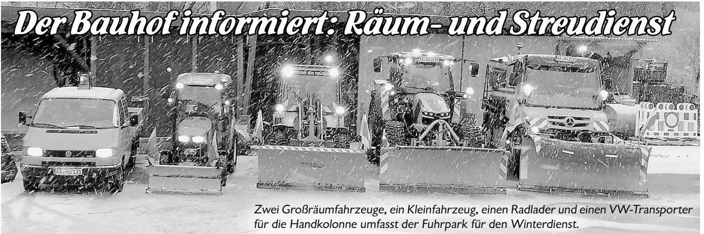
Zwei Großräumfahrzeuge, ein Kleinfahrzeug, einen Radlader und einen VW-Transporter für die Handkolonne umfasst der Fuhrpark für den Winterdienst.

Noch werden wir mit milden Temperaturen verwöhnt, dennoch möchten wir Sie informieren.