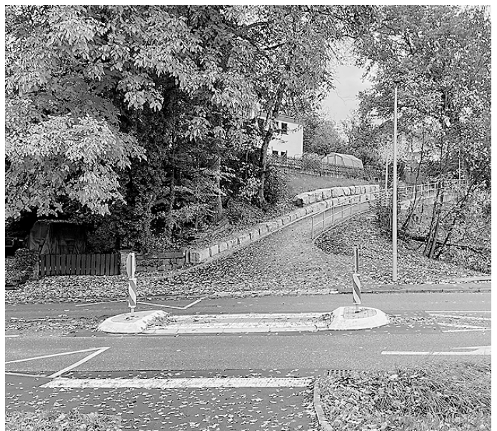
Der neu gestaltete Fußweg von der Goldshöfer Straße aus betrachtet.

Die Baustelle wurde durch die Firma Gebrüder Eichele aus Untergröningen abgewickelt. Zunächst wurde eine Hangsicherung in Richtung Speidelsklinge durch 31 Stück Mikropfähle, mit einer durchschnittlichen Länge von sechs Meter, erstellt. Auf die zur Tiefengründung erstellten Pfähle wurde ein Stahlbetonbalken als zukünftige Wegesicherung aufbetoniert. Danach wurden die weiteren Tief- Straßen – und Leitungsbauarbeiten ausgeführt. Zum Abschluss wurden zwei neue Straßenleuchten und ein Absturzgeländer in feuerverzinkter Ausführung installiert.