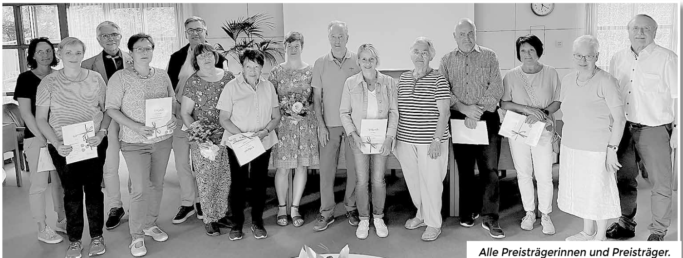
Alle Preisträgerinnen und Preisträger.