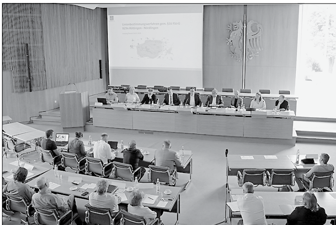
Landrat Dr. Joachim Bläse (Mitte) begrüßte zum Scoping-Termin im Großen Sitzungssaal des Landratsamts Ostalbkreis in Aalen