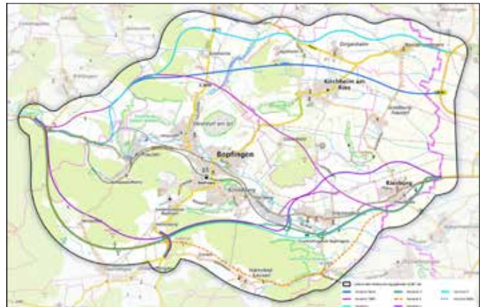
Auszug aus den Scoping-Unterlagen: Der Untersuchungsraum der Umweltverträglichkeitsstudie

Der Geschäftsbereich Verkehrsinfrastruktur wird nun die Stellungnahmen und Anmerkungen aus dem Scoping-Termin aufarbeiten.