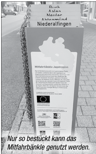
Nur so bestückt kann das Mitfahrbänkle genutzt werden.

Mehr zum Mitfahrbänkle auf unserer Homepage https://www.huettlingen.de/gemeinde-buerger/gemeindeleben/ortsmobil-und-oepnv/mitfahrbankle