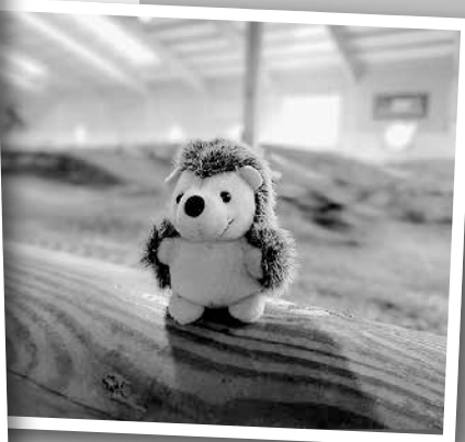
In der MX Bayerhalle in Massing, Linus Nagel

Noch bis zum 9. November mitmachen. Bilder bitte an gemeinde@huettlingen.de