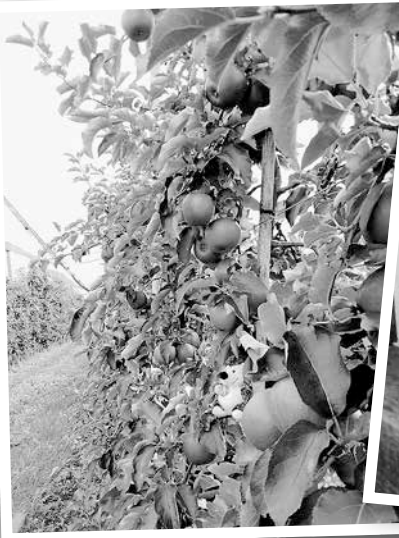
Apfelernte am Bodensee, Karin Schlipf

Der Muffigel versteckte sich in der üppigen Apfelernte und ließ seinen Blick über den großen See schweifen.