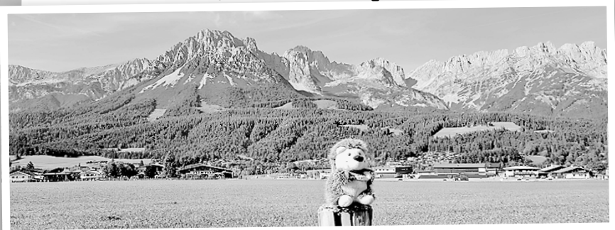
Vor dem Wilden Kaiser in Tirol