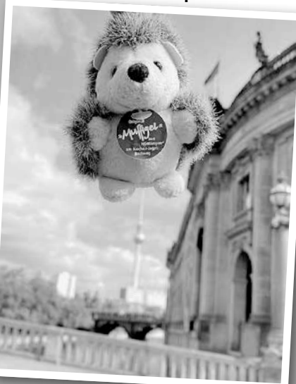
Museumsinsel in Berlin, Frank Fischer

Der Muffigel auf der Spitze unserer Hauptstadt