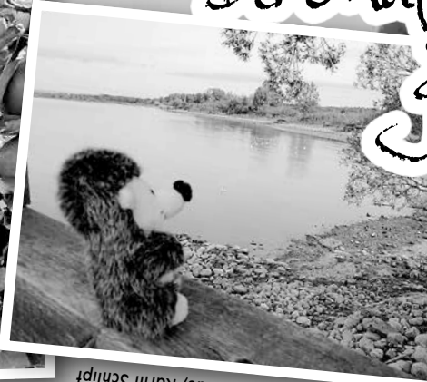
Bodensee, Blick auf Birnau, Karin Schlipf