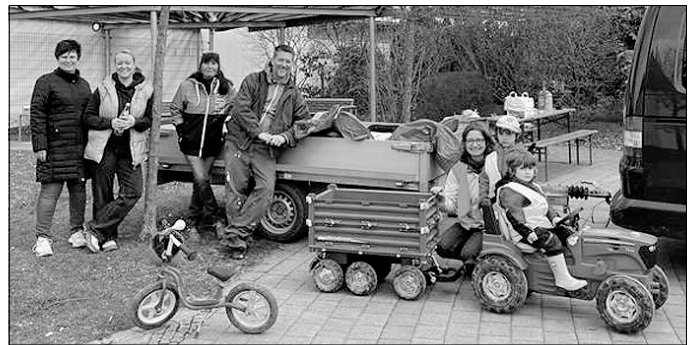
Die Dorfgemeinschaft Seitsberg war auch wieder bei der Kreisputzete dabei.