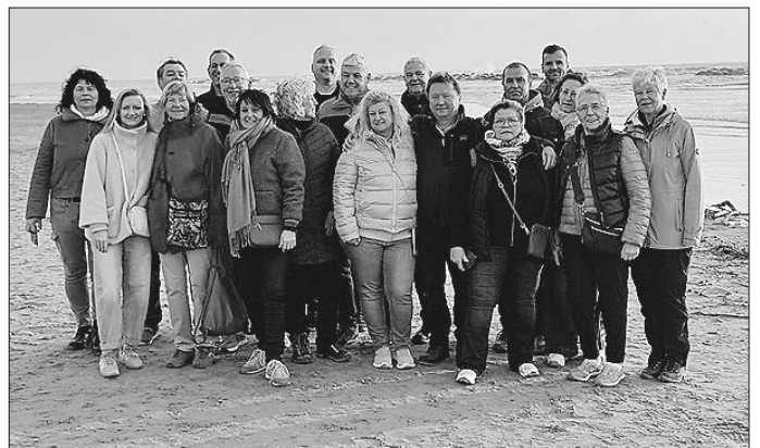
Am Meer, nahe Ravenna, durfte am Sonntagmorgen der Sonnenaufgang genossen werden.