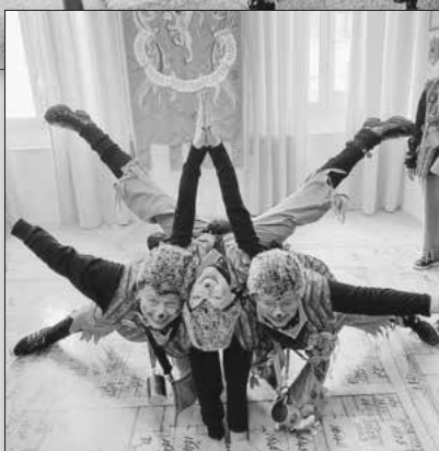
Die Stachelmäzen bereicherten den Umzug am „Festa della Segavecchia“.