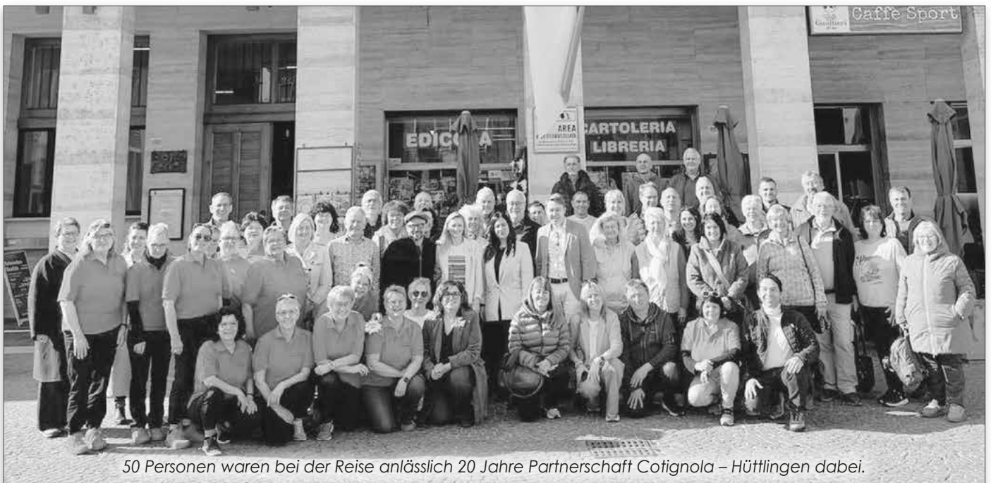
50 Personen waren bei der Reise anlässlich 20 Jahre Partnerschaft Cotignola – Hüttlingen dabei.

Im nächsten Jahr, 2027, wird die Vertragsunterzeichnung in Hüttlingen gefeiert werden und auch der Partnerschaftsverein „Insieme“ feiert sein 20-jähriges Bestehen .