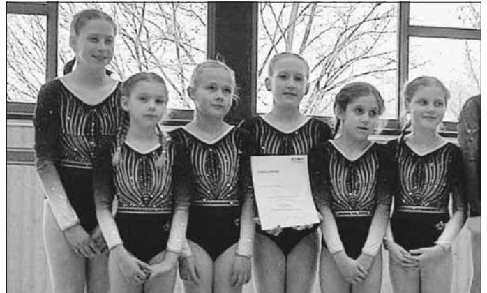
Mannschaft Juti D