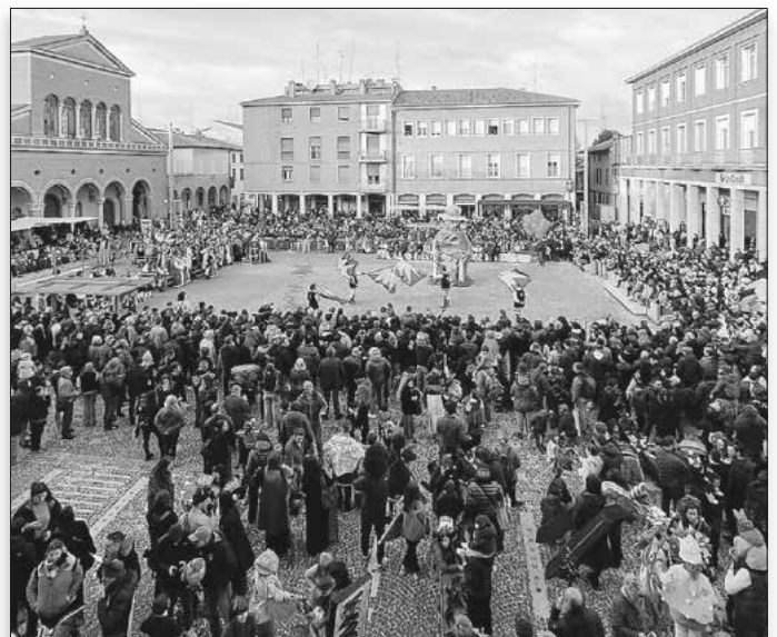
Beim mehrtägigen „Festa della Segavecchia“ wird der Winter verabschiedet und der Frühling begrüßt.