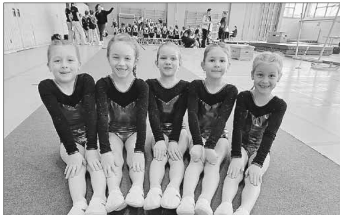
Mannschaft Juti F

Für den Endkampf am 25. April 2026 in Nattheim qualifizierten sich aus Hüttlinger Sicht folgende Mannschaften: die Mannschaft der Juti F sowie die Mannschaften TSV Hüttlingen 1 der Juti D und TSV Hüttlingen 1 der Juti C . Dort treffen sie auf die besten Teams aus den Bereichen Heidenheim und Schwäbisch Gmünd. Ein besonderer Dank gilt den Organisatorinnen, den zahlreichen Helferinnen und Kampfrichterinnen sowie allen Trainerinnen, die gemeinsam für einen reibungslosen Ablauf und eine rundum gelungene Veranstaltung sorgten. Ebenso bedanken wir uns herzlich bei allen Kuchen- und Brezelspendern für die Unterstützung. Alle Ergebnisse sind im Internet unter www.tgow.de abrufbar.