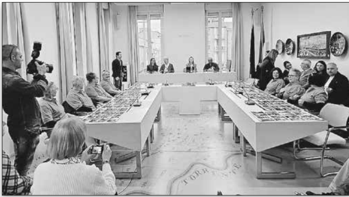
Beim Festabend im Rathaus in Cotignola wurde auf die Anfänge der Partnerschaft zurückgeblickt.