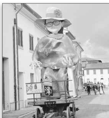
Die „alte Frau“ aus Pappmaché wurde der Tradition nach geköpft und verbrannt.