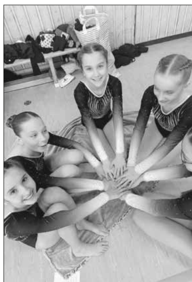
Mannschaft Juti C