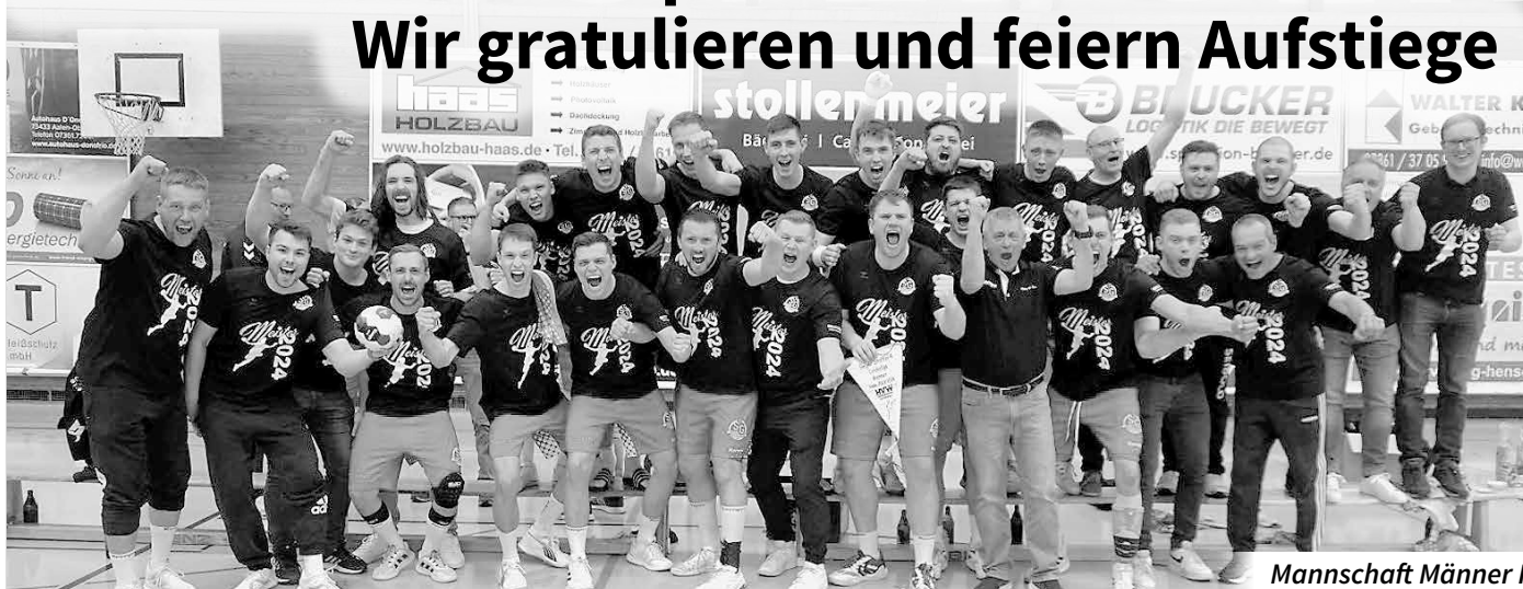
Mannschaft Männer I