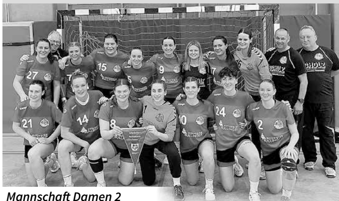
Mannschaft Damen 2