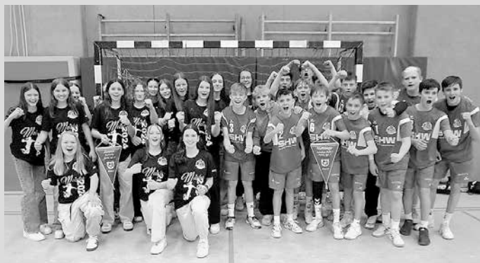
Weibliche und männliche Jugend C

Unsere Handballerinnen und Handballer der SG2H waren bei ihren letzten Spielen außerordentlich erfolgreich.