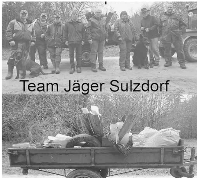
Team Jäger Sulzdorf