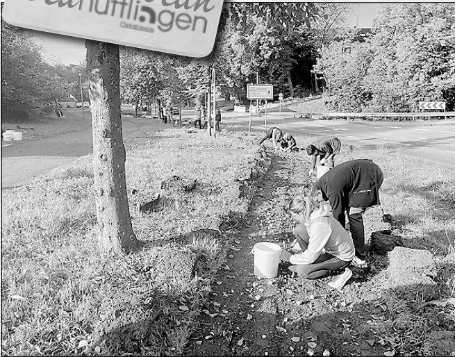
Pflanze um Pflanze und Blumenzwiebel um Blumenzwiebel wurde mittlerweile von vielen Fleißigen in die vom Bauhof vorbereiteten Flächen versenkt.

Der Bürger-Stammtisch Hüttlingen natürlich war am vergangenen Samstag im Bereich des Münz-Kunstwerkes an der Goldshöfer Straße im Einsatz.