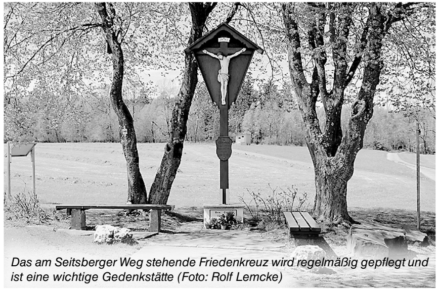
Das am Seitsberger Weg stehende Friedenskreuz wird regelmäßig gepflegt und ist eine wichtige Gedenkstätte

Das Friedenskreuz wurde 1974 an Christi Himmelfahrt von den Mitgliedern des Krieger- und Reservistenvereins eingeweiht. Es dient als sichtbares Zeichen der Völkerverständigung und soll den nachfolgenden Generationen eine Mahnung sein, dass unsere Heimat nie wieder in