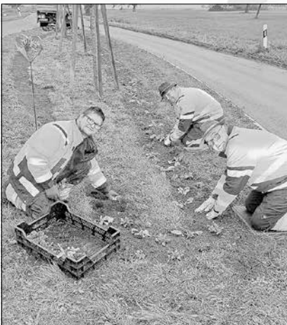
Vom Bauhof wurde der Kreisel in der Sulzdorfer Straße und der Fahrbahnteiler in Sulzdorf bepflanzt.

Am Samstag, 28. Oktober lädt der Obst- und Gartenbauverein ab 9.00 Uhr zum Mitmachen ein. Treffpunkt ist der Kastanienbaum an der Kocherbrücke. Einige 1000 Blumenzwiebeln sollen im vorderen Bereich der Kocherböschung gepflanzt werden.