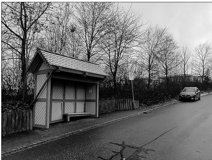
Der Grünstreifen zwischen der Königsberger und der Sulzdorfer Straße wird aufgrund des Umbaus der Bushaltestelle gerodet werden.