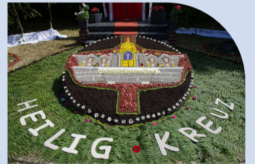
FRONLEICHNAMSFEST Heilig Kreuz Kirche