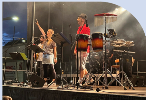
HÜTTLINGER KULTURNACHT Ortskern