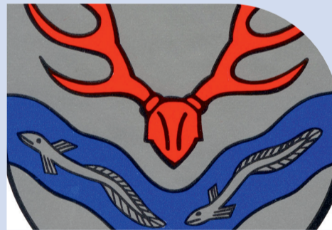
FESTAKT 1000 JAHRE HÜTTLINGEN Bürgersaal