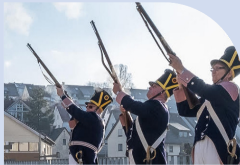
33. NEUJAHRSSCHIEßEN der Bürgergarde Hüttlingen am Forum