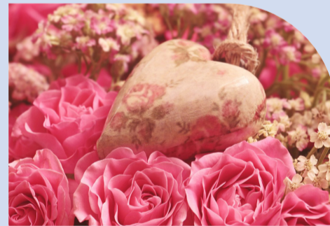
PLATZKONZERT am Muttertag Musikverein Hüttlingen vor Begegnungsstätte