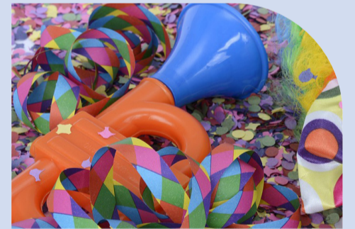
FASCHINGSBALL TSV Abteilung Fußball Bürgersaal